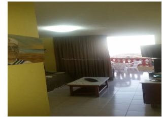
LAGUNA PARK 2

CALLE "C" (cerca de la recepcion) 1 dormitorio 1 baño Planta baja Vistas al mar 42 m2 interior 11 m2 terraza comunidad €206 (incluida agua y luz) Piscina comunitaria Mini golf Recepción 24h Parking comunitario Supermercado Sala de juego Restaurante Bar Cancha de tenis, baloncesto y futbol Disco club