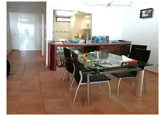
Elegantes Apartment mit Meerblick in Playa Paraiso

Im Herzen von Playa Paraiso gelegen, pr sentieren wir Ihnen diese helle, nach S den ausgerichtete Wohnung im ersten Stock, die von ihrer ger umigen 20 m2 gro en Terrasse einen Panoramablick auf das Meer bietet.